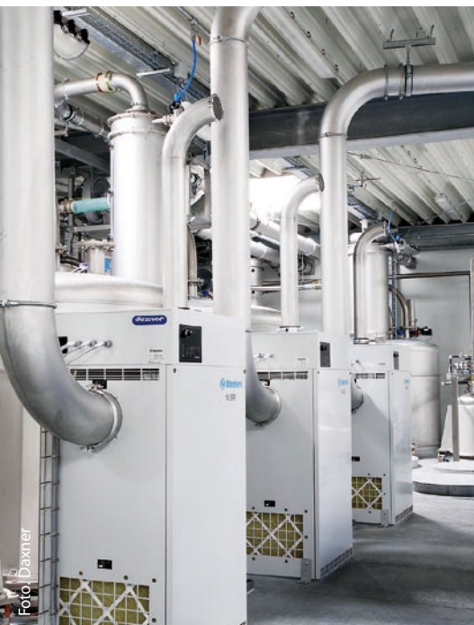
Konditionierte Luftaufbereitung für pneumatische Druckförderung