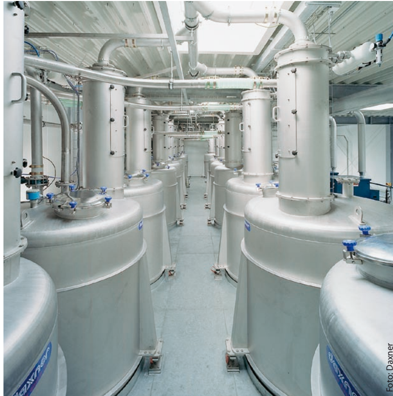
Tagesbehälter zur Vorlage von Komponenten wie Milchpulver, Kakaopulver, Zucker etc. werden pneumatisch, unter Verwendung von gekühlter und getrockneter Förderluft beschickt.

diese heute weltweit, produziert werden sie an den drei österreichischen Standorten Wien, Wolkersdorf und Perg. Groß wurde das Traditions-Unternehmen dabei durch die „Original Manner Neapolitaner Schnitten“, die durch die charakteristische rosarote Packung und den Werbespruch „Manner mag man eben“ zu großer Popularität kam.