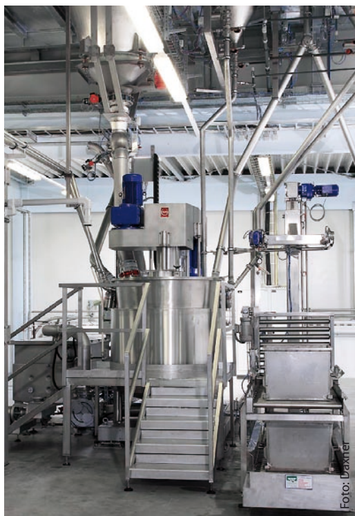
Zuführung der Pulver- und Flüssigkomponenten in den Dissolvermischer.

die überdurchschnittlich leistungsfähig und gleichzeitig leistungsfähig sind. Mit diesem Ansatz vor Augen haben wir uns auch an die Planung der Masseaufbereitungsanlage für Manner gemacht.“