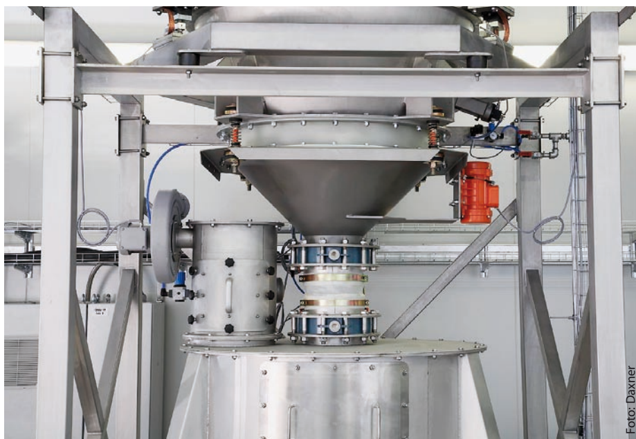
Behälterwaage mit Vibroausstragboden, Waagenachbehälter und Schleusenleckluft-Abführung mittels Düsenfilter DFK.