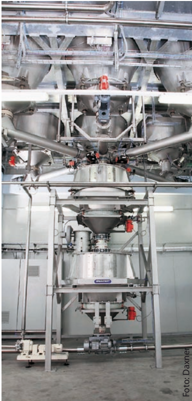
Exakte Dosierung der Chargenkomponenten durch Dosierschnecken in die Behälterwaagen und pneumatische Zuführung in den Dissolver-Mischer