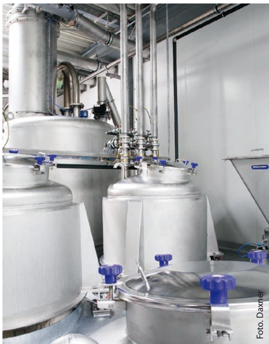
Beheizbare Pufferbehälter für Flüssigkomponenten

Zitrone oder Vanille: Sämtliche Streichmassen müssen durch einwandfreien, absolut sortenreinen Geschmack überzeugen, wodurch höchste Anforderungen an Hygiene und Reinigungsfreundlichkeit zu erfüllen sind. Die Tagessilos sind daher rund ausgeführt, die Transportluft getrocknet und gekühlt, so dass keine Rückstände zurückbleiben. Darüber hinaus ist die gesamte Anlage im Werkstoff Edelstahl rostfrei 1.4301 gefertigt, wobei Daxner mit der seit einem Jahr bewährten NIROPUR-Fertigungshalle über einen eigenen, abgeschlossenen Produktionsbereich für Edelstahl-Anlagen verfügt.