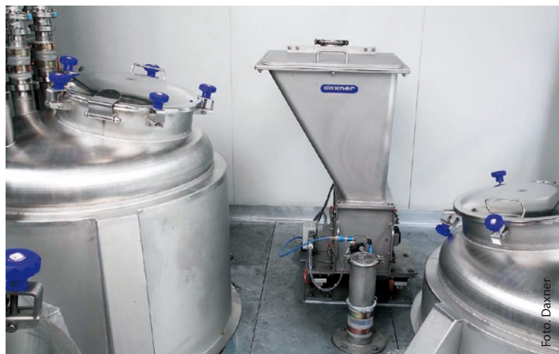
Gravimetrische Dosierung der Kleinstkomponenten mittels Dosierapparat DA 060

und Visualisierung, was eine lückenlose Rückverfolgbarkeit aller Komponenten, die gerade im Falle von Süßwaren wie den Manner Schnitten wichtig ist, sicherstellt. Die Streichmasseanlage selbst erfüllt sämtliche Anforderungen hinsichtlich HACCP und IFS Standards und ist entsprechend ATEX / VEXAT ausgeführt.