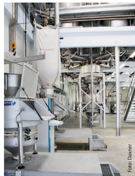
Aufgabestation für die Produktaufgabe von Sackware und Big Bag sowie die pneumatische Förderung in den zugehörigen Tagessilo.

Von den Tages-Silos werden die Chargenkomponenten mittels Dosierschnecke exakt in je drei Behälterwaagen dosiert, wonach