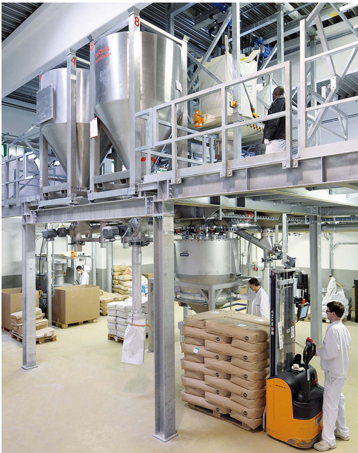
Abb. 1: Container-Big-Bag-Entleerstation mit Dosierung und Behälterwaage (rechts im Bild)

Um der weltweit starken Nachfrage nach phytogenen Zusatzstoffen (jährliche Steigerungsraten bei Delacon von ca. 25%) gerecht zu werden, musste die Anlagenkapazität ver-