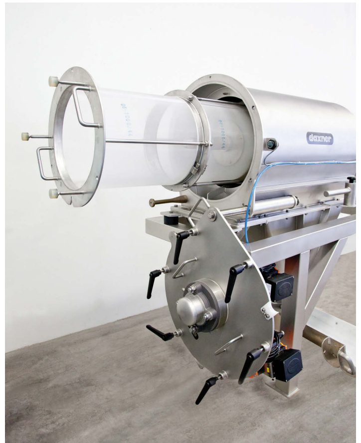
Abb. 3: Wirbelstromsiebmaschine WM30DD, Inlineausführung für den Einbau in die Saugförderleitung