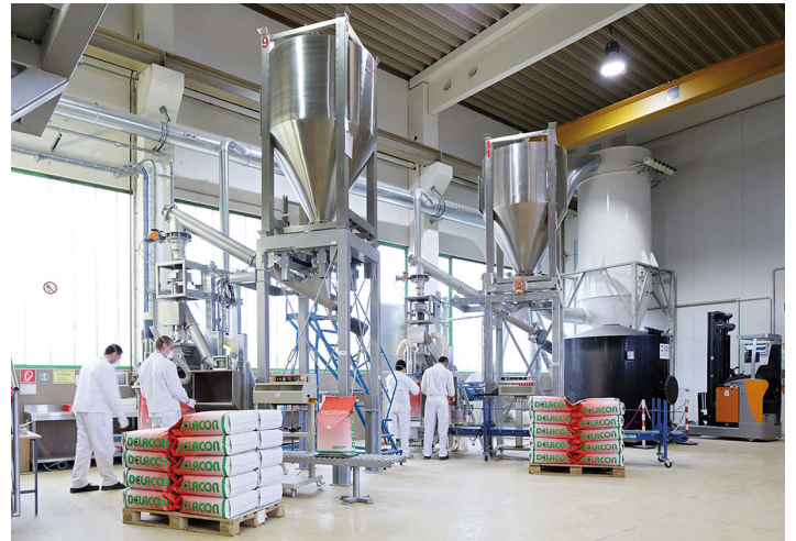
Abb. 2: Container-Entleerstation mit Dosierschnecke, Allmetaldetektion und Abpacklinie, Düsenfilter für die Zentralaspiration

Um den Anforderungen für die Produktion der hochwertigen Produkte gerecht zu werden, wurde in enger Zusammenarbeit zwischen Delacon und Daxner Schüttgut-Technologie, Wels/